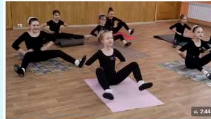
Театр моды и танца DANCE AND MODELS / #узнавайки 2339 просмотров

На базе нашей школы уже несколько лет работает театр моды и танца "DANCE AND MODELS", где ребята учатся искусству хореографии. Они посещают занятия по ритмике, растяжке, гимнастике, современным и эстрадным танцам! Показать ещё